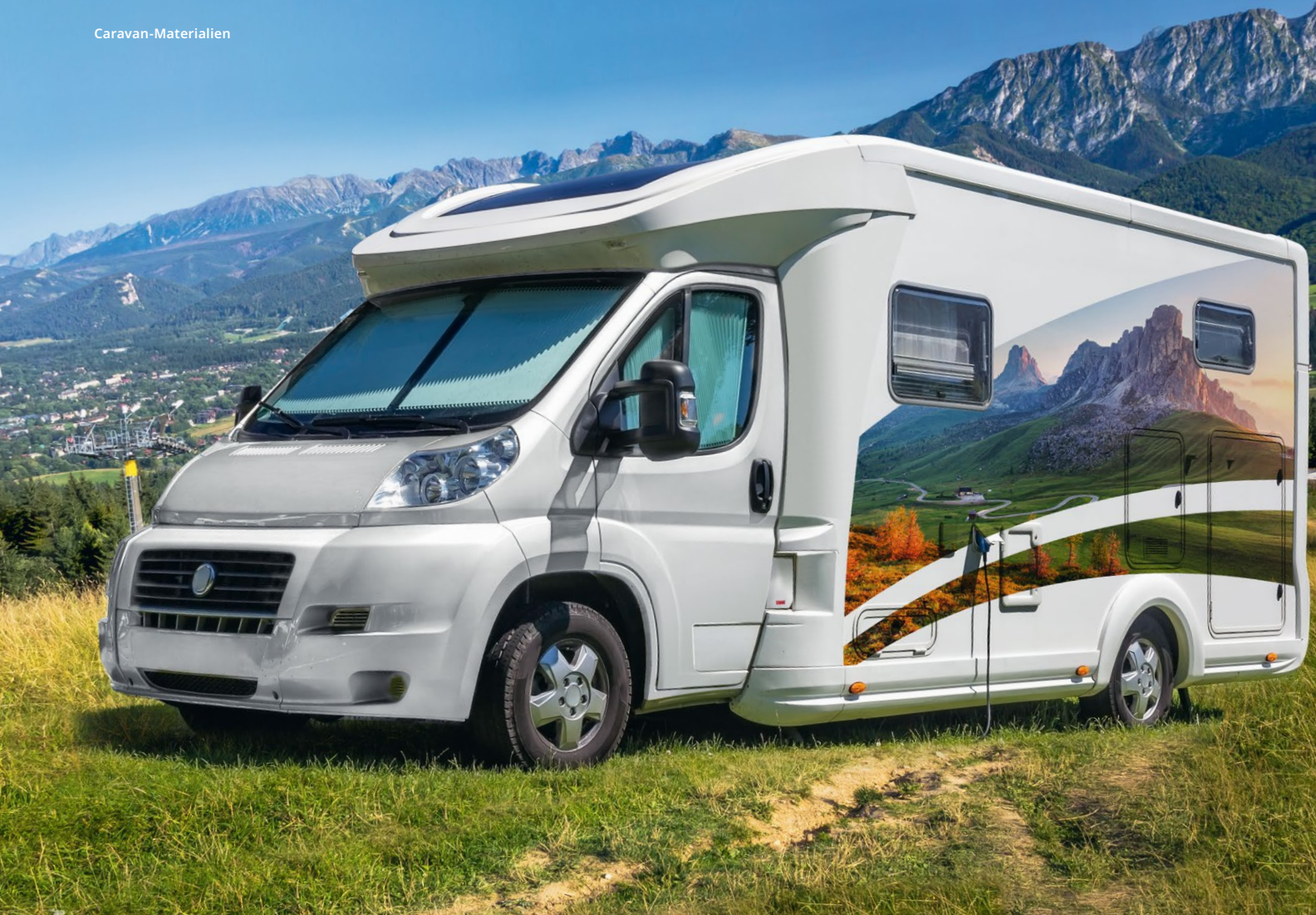
Beispiel für ORAJET® 3106SG