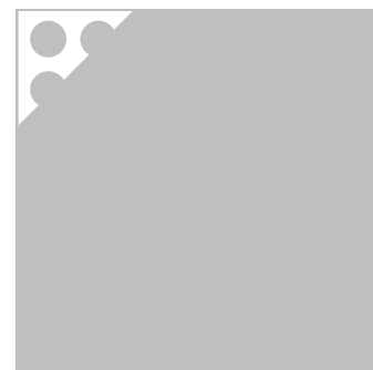
ORAFLEX® 11786 Hart