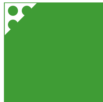
ORAFLEX® 11786 Hart